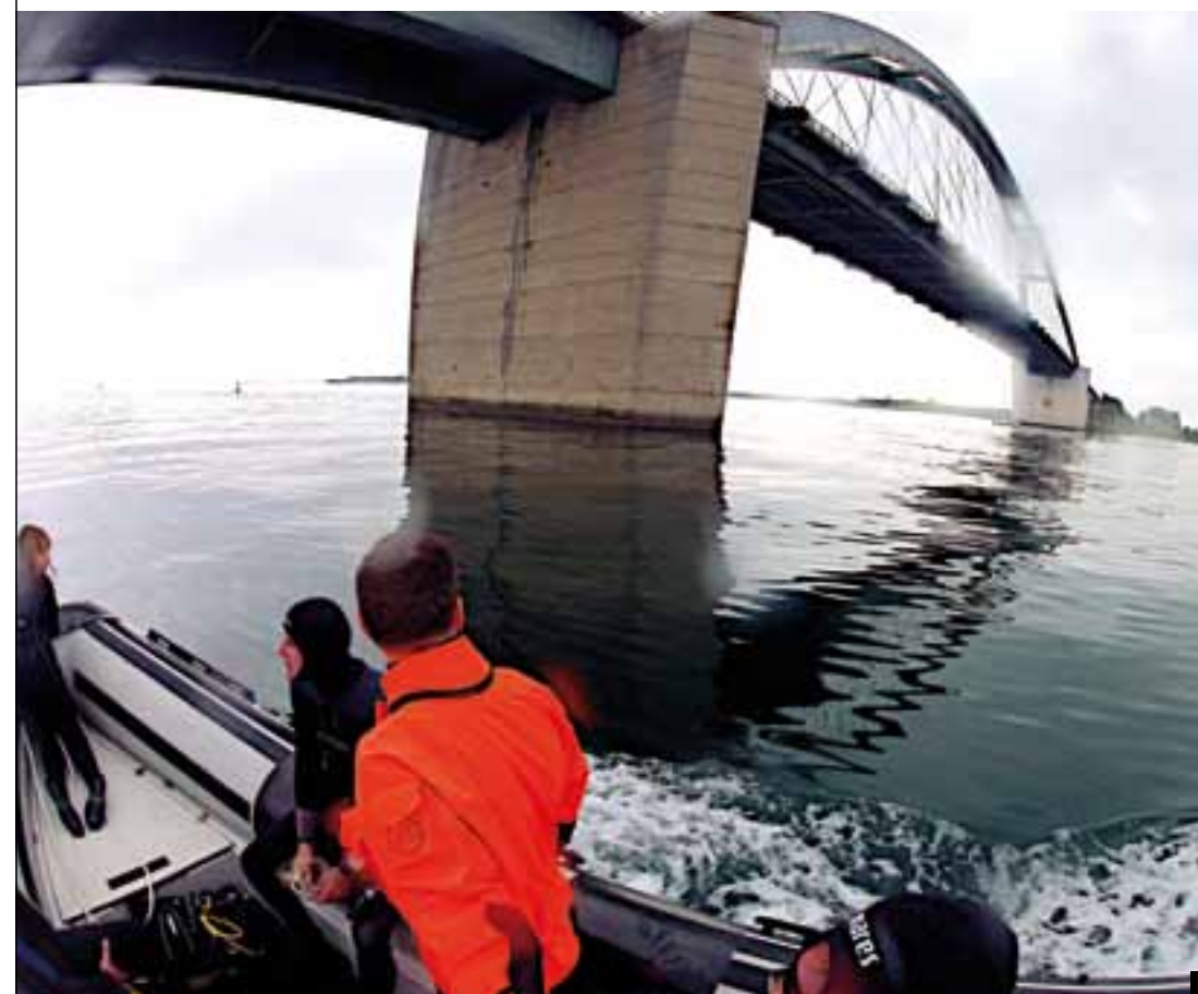
10 | Das Wrack der „Falke“ ist überwuchert mit Seenelken. 11 | Fertigmachen zum Tauchen unter der Fehmarnsundbrücke. 12 | Die Ostseebasis Fehmarn

kann man mit oder ohne Bootsführerschein Boote mieten oder den Ausblick auf die Küste und den Wulfener Hals genießen. Fehmarn kann man zwar auf der Bundesstraße schnell durchqueren, jedoch sind die schmalen Wege durch die vielen kleinen Orte empfehlenswert, wenn man es nicht eilig hat. Auf diese Weise konnten wir auch die etwas abseits des Tourismus gelegenen Schönheiten der Insel entdecken. Wer Urlaub auf Fehmarn macht, sollte auf jeden Fall einen Abstecher in den Norden der Insel einplanen. Puttgarden ist bekannt für seinen riesigen Fährhafen. Wie am Fließband legen dort viele große Fährschiffe an, die aus Skandinavien kommen oder dorthin fahren. Von einer großen Mole beobachten wir das Spektakel ganz aus der Nähe, während uns der warme Wind um die Ohren pfeift. Zum Abschluss lassen wir uns noch leckere Fischbrötchen schmecken und genießen die Aussicht bis nach Dänemark.